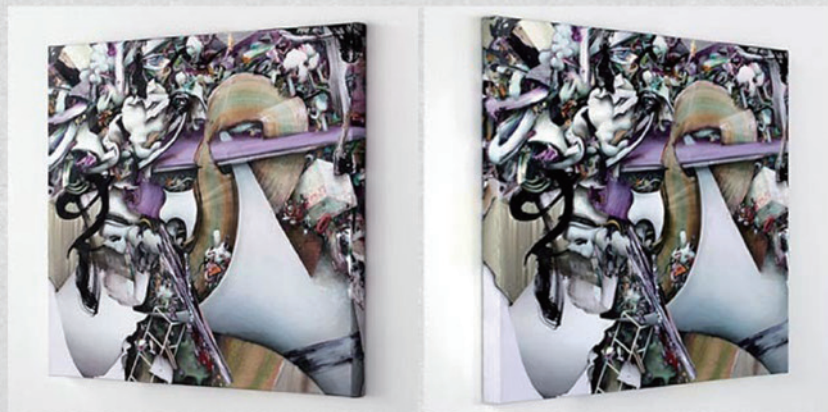
The Accumulation Rhythm V, oil/alkyd/oil pastel on canvas, 96.2x110.4x5.9cm, 2012(Side View)