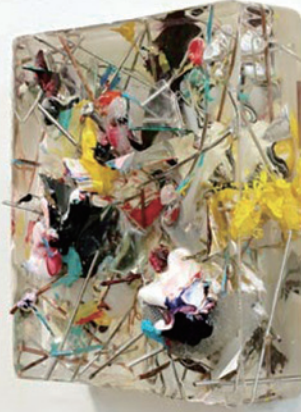
Semi-Object #2, mixed media, H14.3xW14.3x D4.6cm, 2011