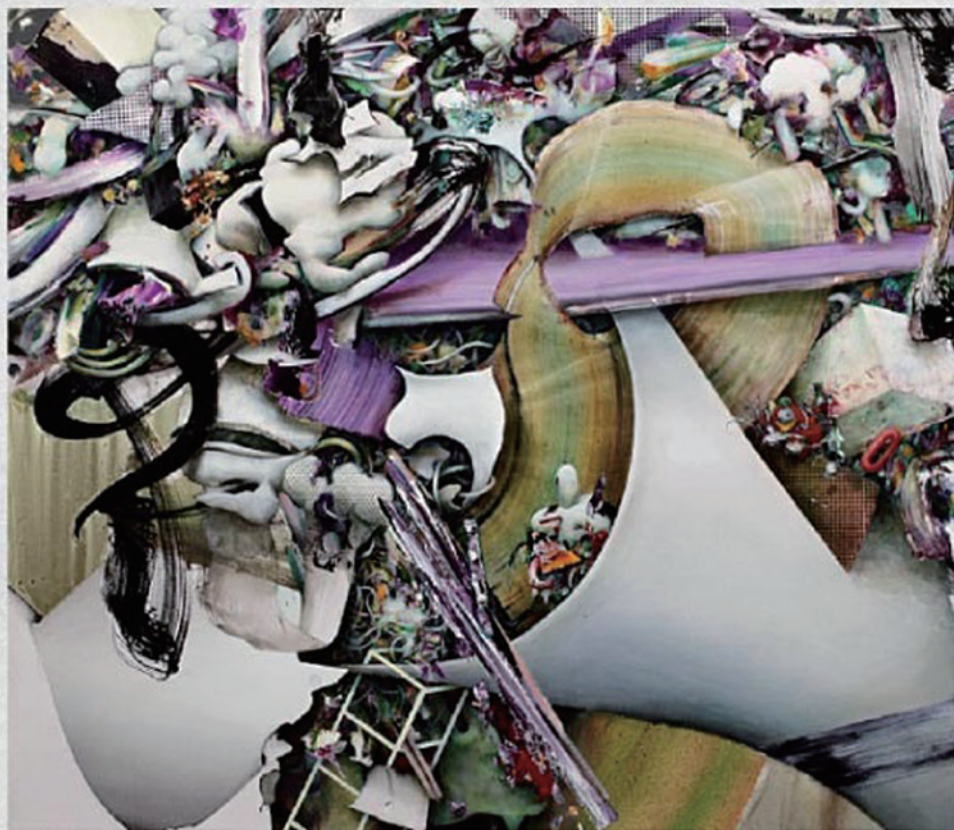
The Accumulation Rhythm V, oil/alkyd/oil pastel on canvas, 96.2 × 110.4 × 5.9cm, 2012

Frantic Gallery, 東京 2013年3月20日(水) – 24日(日)