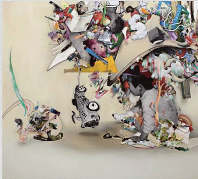
Revolting Image, silk screen/oil/alkyd on canvas, 130.2 x 144.6 x 6.2cm, 2012